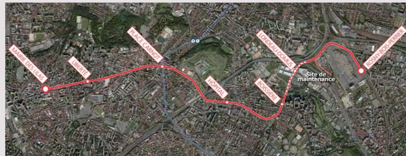
Le tracé du prolongement de la ligne 11 du métro

La station Place Carnot sera située en bordure de la place Carnot. Elle permettra de desservir un pôle de centralité majeur accueillant des commerces, le cinéma Le Trianon et offrira une connexion avec la ligne de tramway T1.