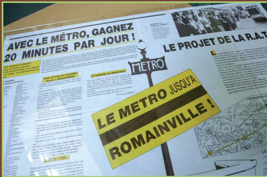
Le premier bulletin édité par le Comité pour le Métro

Le prolongement de la ligne 11 occupe les esprits depuis un grand nombre d'année. Une délibération du conseil municipal de Romainville demande dès décembre 1900 que la commune soit reliée au centre de Paris par une ligne de métro! Durant tout le 20 ème siècle, la municipalité ne va cesser de réclamer ce prolongement et tous les moyens seront utilisés : vœu au conseil général, lettre au préfet, question écrite au ministre des transports, pétition, manifestation, inauguration symbolique d'une station « place du marché »... pour aboutir à la création du comité pour le métro en mars 1989.